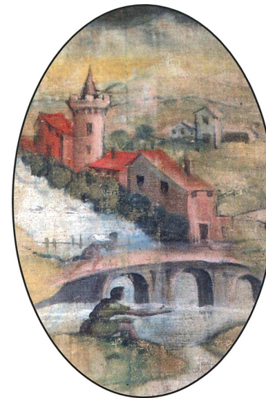
Il Castello di Corneto raffigurato in un antico dipinto conservato nella chiesa di Quarto (Sarsina)