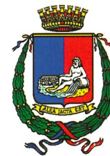
Provincia di Forlì