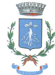
Comune di Verghereto