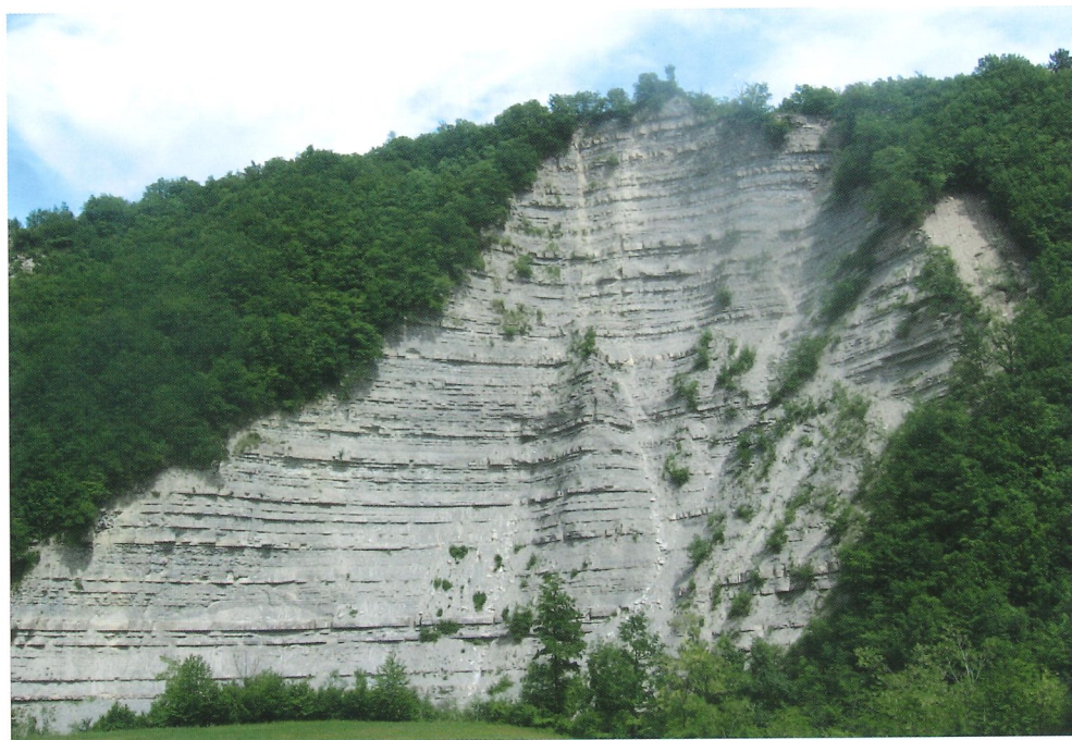
Rupe di Corneto

Rinier da Corneto fu padre del famoso capitano ghibellino Ugucione della Faggiola (1250 circa - 1319). A riprova di ciò, Emanuele Repetti cita, tra l'altro, un atto notarile del 9 dicembre 1298 con menzionati i fratelli Ugucione e Ribaldo figli del fu Ranieri della Faggiola. Localmente si narra che Dante, ospite di Ugucione della Faggiola nel castello di Corneto, sia rimasto talmente colpito dalla successione marnoso-arenacea suborizzontale, bene evidente nella rupe sottostante, da trarne l'ispirazione dei gironi infernali.