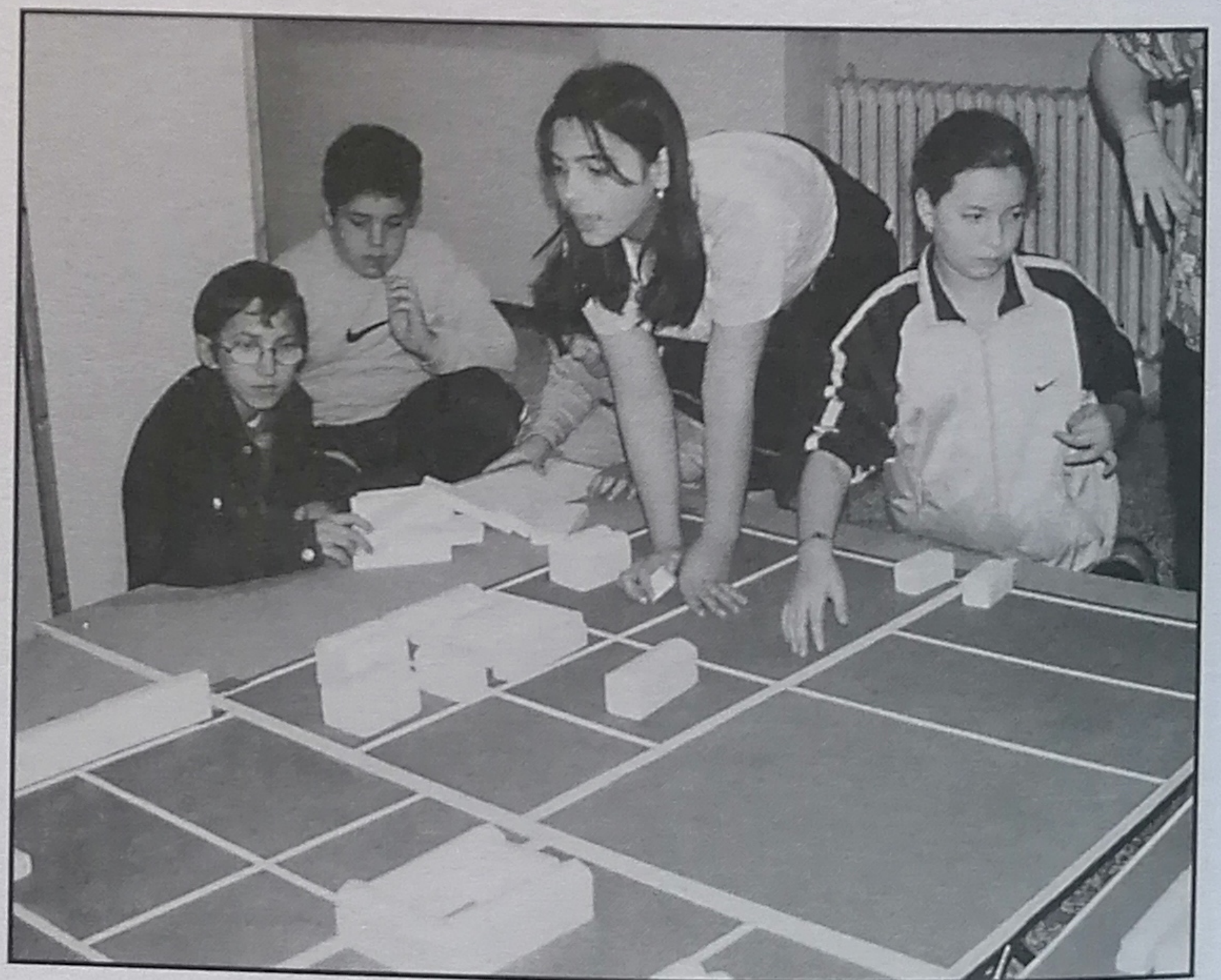
Fig. 3 - Ricostruzione di un impianto urbanistico di età romana

Il laboratorio di età romana, suddiviso anch'esso in una parte storico-teorica ed in una pratico-ludica, affronta in maniera approfondita alcuni aspetti che molto spesso vengono solo sfiorati dai testi scolastici.