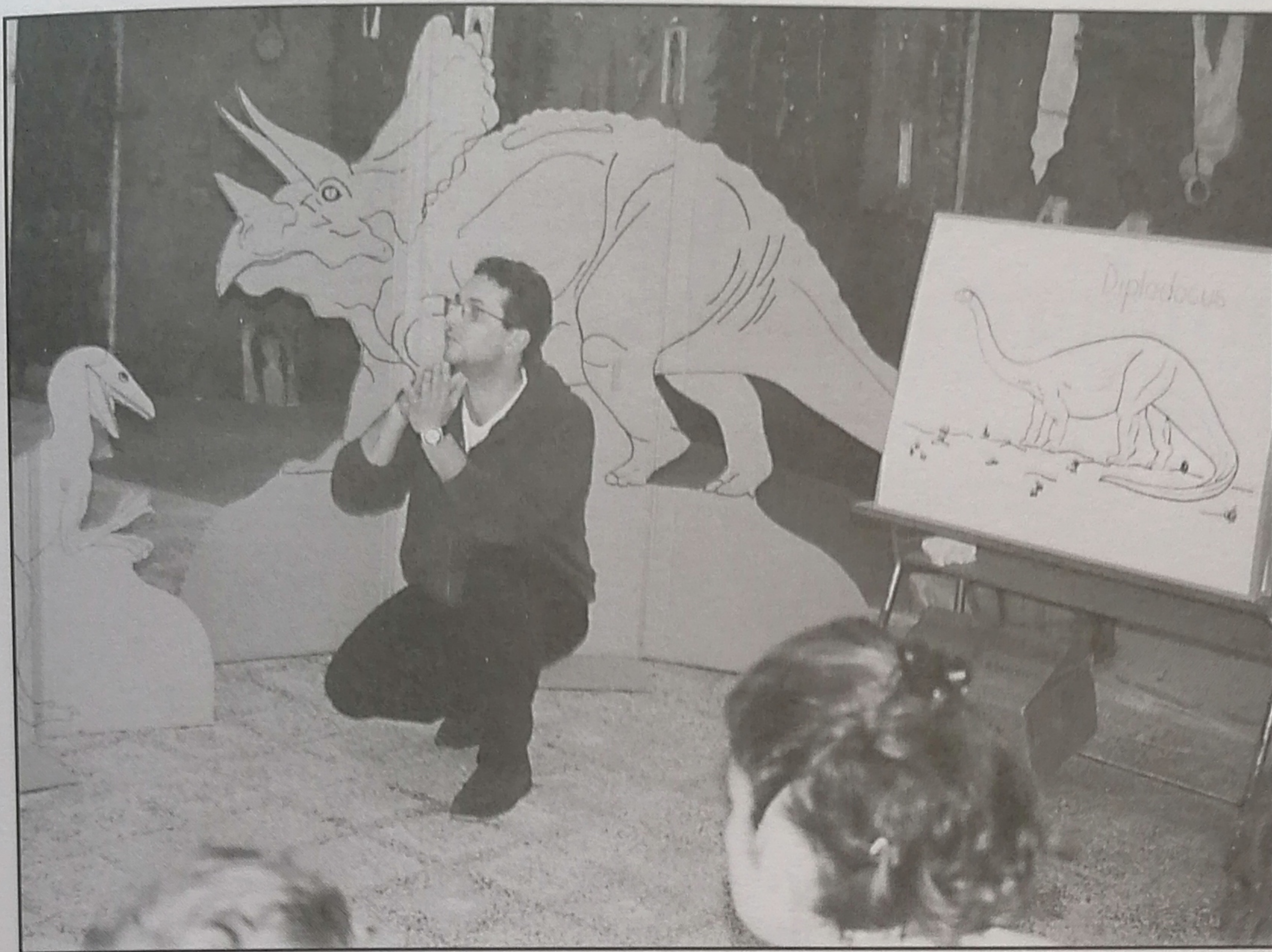
Fig. 4 - L'analisi del mondo dei Dinosauri nel progetto "Dinosaurite"

Dapprima l'esercito, prendendo in esame la vita del legionario, le armi, la costruzione e l'assetto dell'accampamento, il ruolo delle legioni nella progettazione e nella creazione di strade, acquedotti e nella realizzazione del paesaggio centuriato.