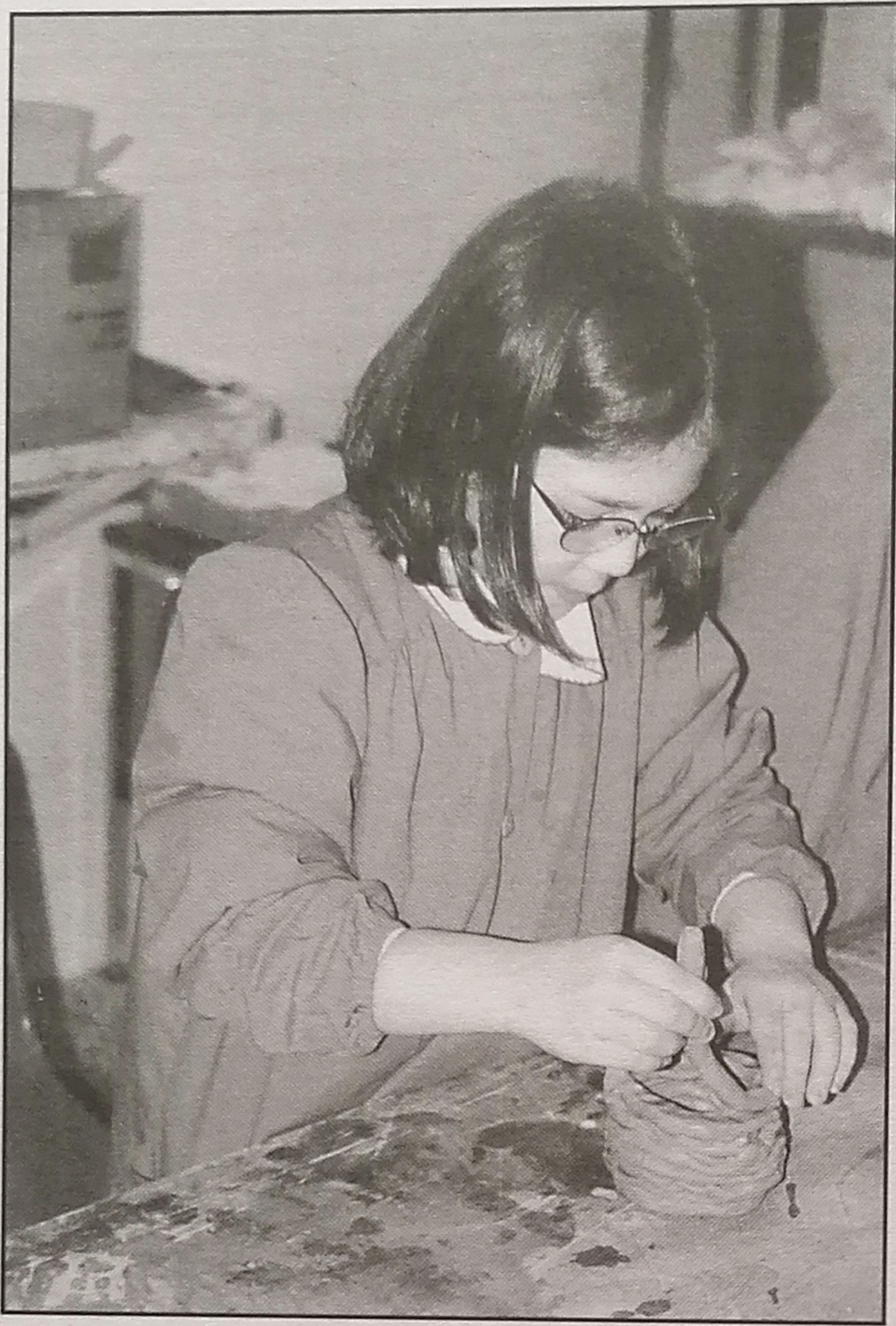
Fig. 2 - Realizzazione di un manufatto ceramico preistorico, utilizzando la tecnica "a lucignolo"

cipali culture presenti in area locale ed i più importanti ritrovamenti che ad esse si riferiscono, con un'attenzione particolare sulle tecniche utilizzate per la fusione dei metalli.